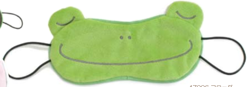
47006 フロッグ 0795136470062