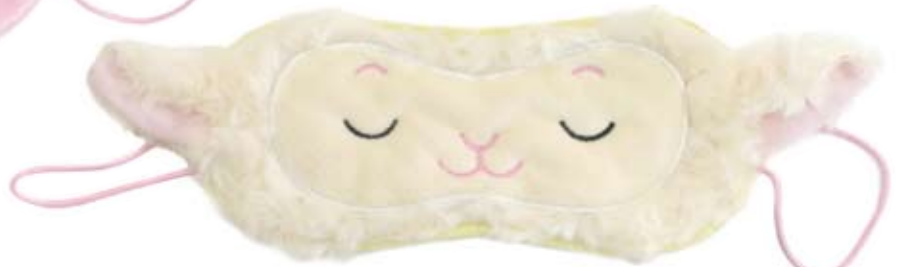
47003 ラム 0795136470031