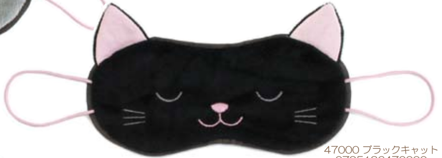
47000 ブラックキャット 0795136470000