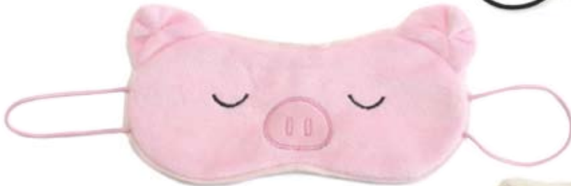
47005 ピッグ 0795136470055