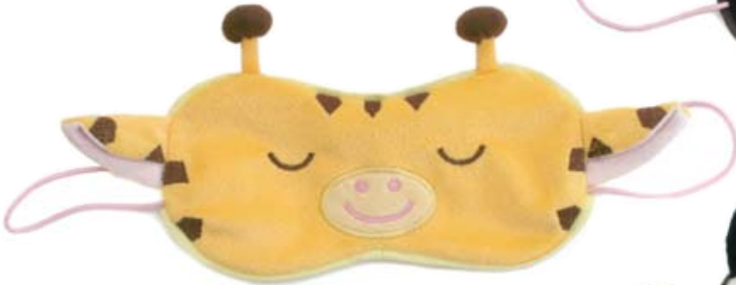
47002 ジラフ 0795136470024