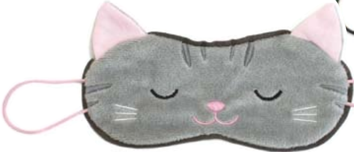
47001 アメリカンショートヘア 0795136470017