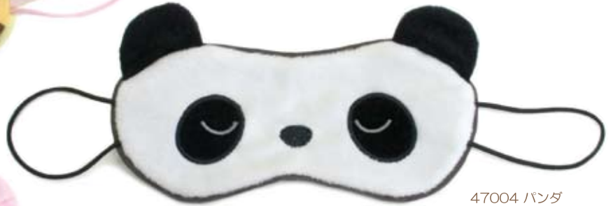
47004 パンダ 0795136470048